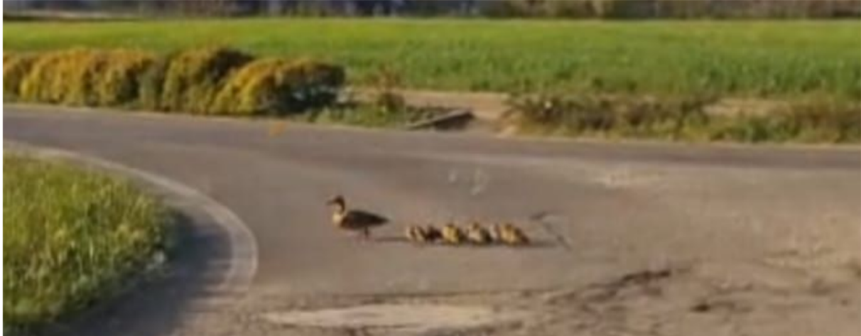
Un famigliola di anatre attraversa la strada in prossimità del laghetto di Caversaccio